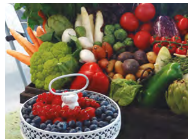
◀ DIA A DIA. La varietat de producte fresc, protagonista de les taules de Nadal