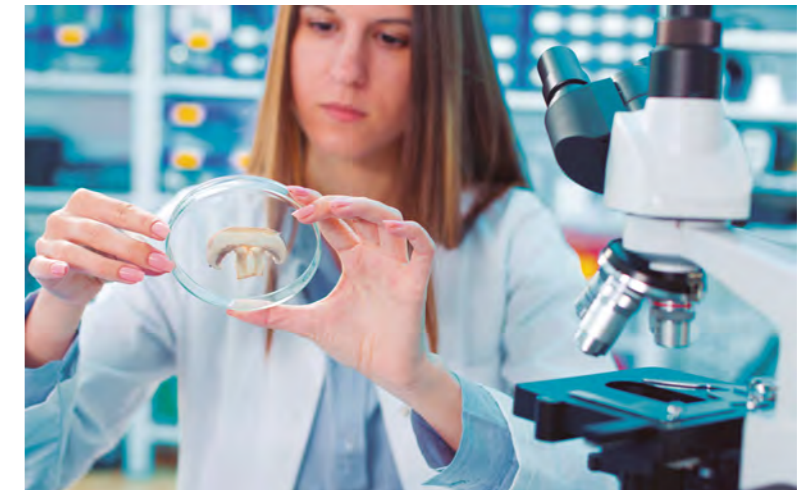
◀ DIA A DIA. La varietat de perfils enriqueix cada àrea de l'empresa