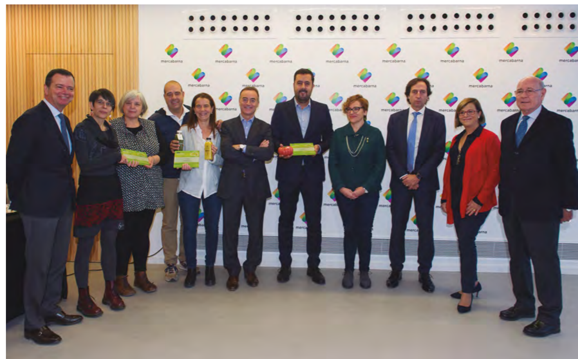
REPORTATGE. La presidenta i el director general de Mercabarna, amb els guanyadors i els membres del jurat

Més informació sobre els premis 'Mercabarna Innova': www.mercabarna.es/premisinnova