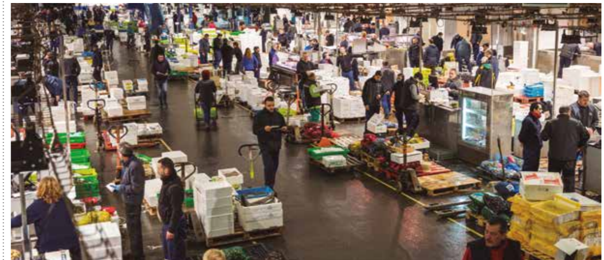
PEIX I MARISC. Imatge del Mercat Central del Peix.

Mercabarna encarrega un informe per conèixer com és el consumidor i adaptar els serveis del mercat majorista a les necessitats dels seus clients.