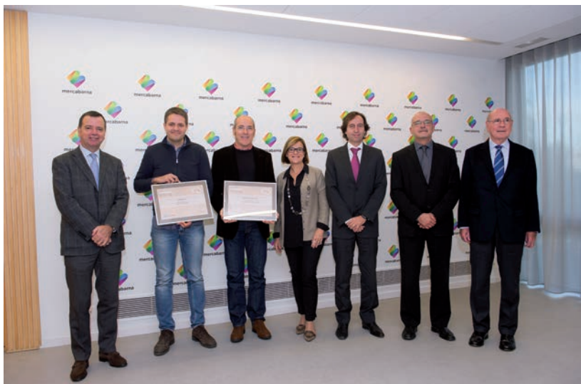
Primera edició dels premis 'Mercabarna Innova', amb els guanyadors, el jurat i el director general de Mercabarna.