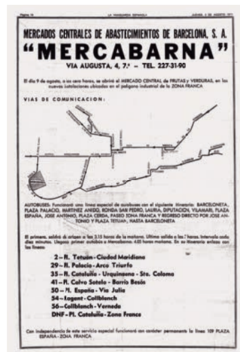
Nova línia d'autobús a Mercabarna ( La Vanguardia , 5 d'agost de 1971).