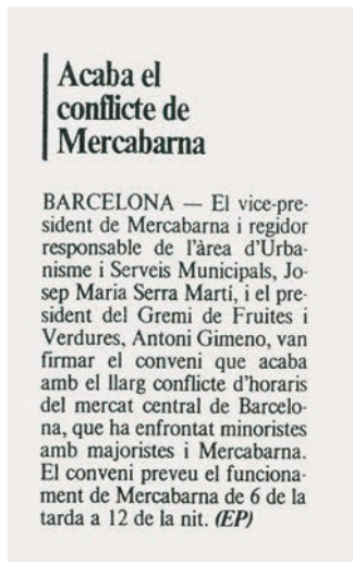
Avui, 22 de juny de 1989.

“ D’aquell procés recordo les intenses negociacions, les protestes, els pactes i el període de transició fins a l’acceptació definitiva del nou horari. Va ser molt complicat implementar aquest canvi, però amb el pas del temps s’ha demostrat determinant en l’èxit del Mercat Central de Fruites i Hortalisses. A Mercabarna vam ser pioners a tot el món i em sento especialment satisfet d’haver-ne format part.