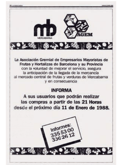
La Vanguardia, 9 de gener de 1988.

Era el president de l'Associació Gremial d'Empresaris Majoristes de Fruites i Hortalisses de Barcelona i Província i va liderar la lluita pel canvi d'horari.