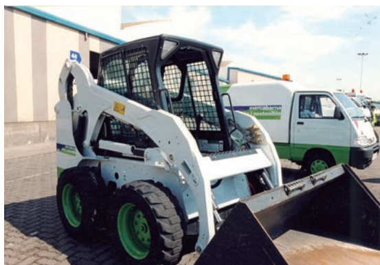
La nova flota de vehicles de neteja.