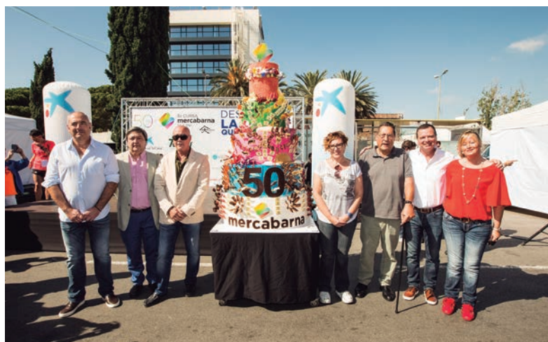
Pastís de celebració dels cinquanta anys a la 3a Cursa Mercabarna.

El 24 de març es dona el tret de sortida a la commemoració del cinquantè aniversari de Mercabarna, una efemèride que es manté present al llarg del 2017. Els mercats i els carrers del recinte es vesteixen de gala per a l'ocasió i grups d'animadors conviden els treballadors a sumar-se a la festa i a fer-se fotografies al fotomaton instal·lat a la zona comercial. Paral·lelament, més d'un centenar de persones es donen cita en un acte institucional en el qual es repassen els moments clau de la història d'aquesta 'ciutat alimentària'. En aquest marc, la Fundació Alicia presenta l'estudi 50 anys d'evolució de l'alimentació a Catalunya , que recull els coneixements de les empreses del polígon al voltant del producte fresc i del comerç majorista. A partir d'aquesta anàlisi, s'organitza una exposició itinerant que recorre diversos espais de Barcelona: el Palau Robert, el Mercat del Ninot, el Mercat de les Corts i, finalment, Mercabarna. Així mateix, la tercera edició de la Cursa Mercabarna manté l'esperit festiu amb un espectacular pastís d'aniversari d'1,7 metres d'alçada i cinc pisos, creat pel pastisser Christian Escribà. Finalment, a finals de novembre té lloc la cloenda dels actes commemoratius, on es fa entrega del llibre Mercabarna. Cinquanta anys creixent junts , que rememora la història de Mercabarna a través del testimoni d'alguns dels seus protagonistes.