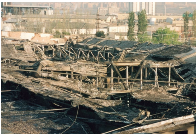
L'estat del Mercat de la Flor després del devastador incendi.

El dissabte 21 d'abril, a les 9.35 hores, un imponent incendi provoca la destrucció total del Mercat, enormes pèrdues materials per a les empreses i l'ingrés hospitalari de deu persones en estat lleu. El foc redueix a cendres l'edifici, però no destrueix l'esperit lluitador del Mercat de la Flor, ja que l'endemà mateix la direcció de Mercabarna i l'Associació d'Empresaris Majoristes (AEM) habiliten una carpa provisional per continuar amb la campanya de Sant Jordi. Aquell dia 700 floristes mostren el seu suport anant a comprar a Mercabarna: es venen 500.000 roses i s'aconsegueix mantenir el volum de comercialització de l'any anterior. Finalment, el 9 de juliol s'inaugura un mercat de la flor provisional, que disposa dels serveis necessaris per atendre els clients.