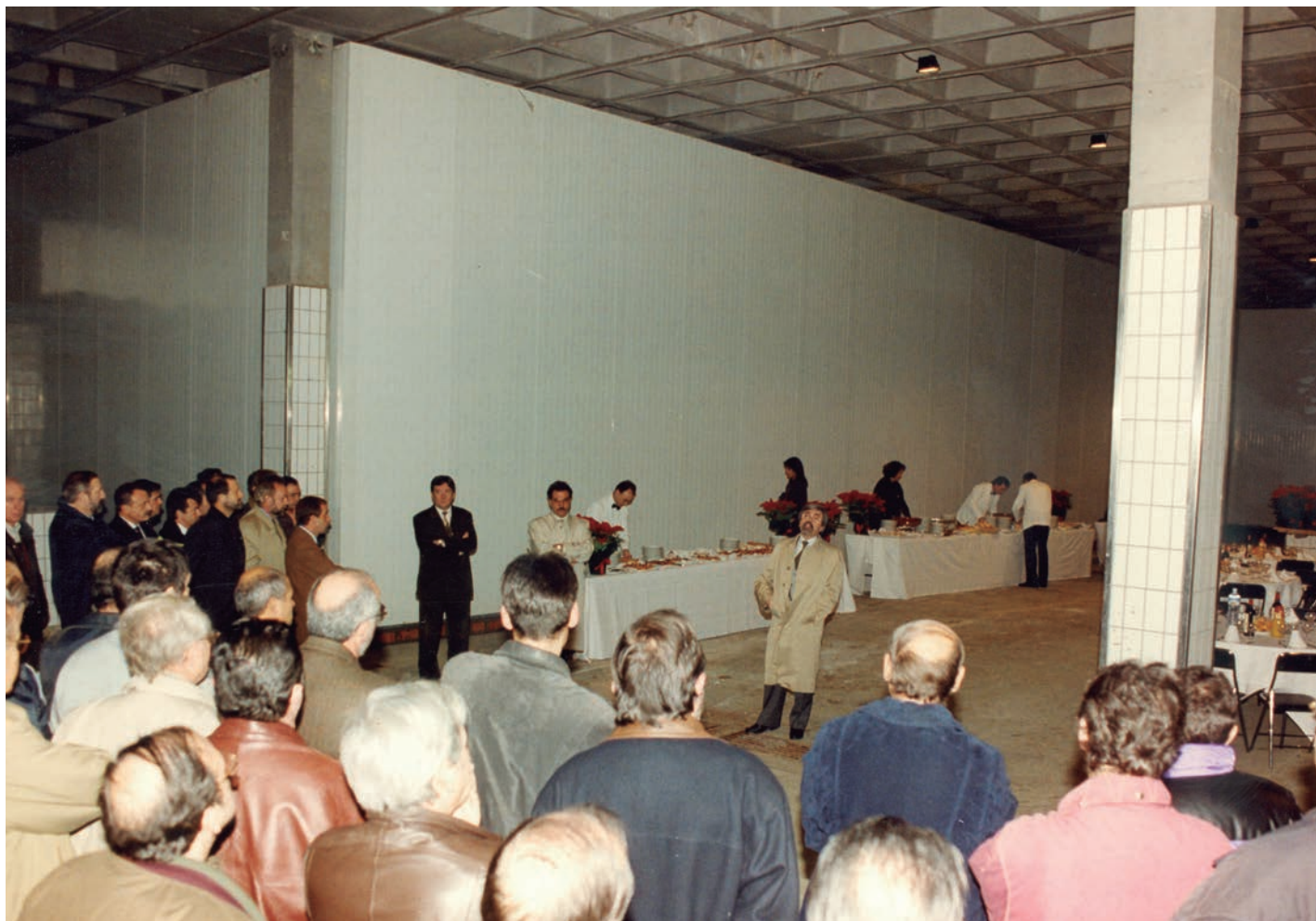
Acte inaugural de la línia de boví de l'Escorxador.

L'Escorxador comença l'exercici amb la posada en marxa d'una nova línia de sacrifici boví que presta un servei flexible i adaptat a les necessitats de cada client i a les especificitats del bestiar, tant boví com equí, i incorpora millores en tecnificació. A més, també s'enllesteixen les instal·lacions de la nova triperia especialitzada en el tractament de les despulles.