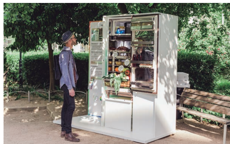
De dalt a baix, tret de sortida de la celebració del cinquantè aniversari amb animació a Mercabarna i exposició 50 anys d'evolució de l'alimentació a Catalunya al Palau Robert.