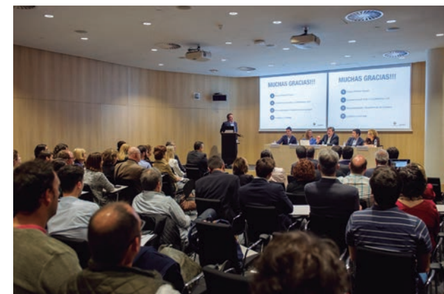
Dues jornades de l'Observatori de Tendències.