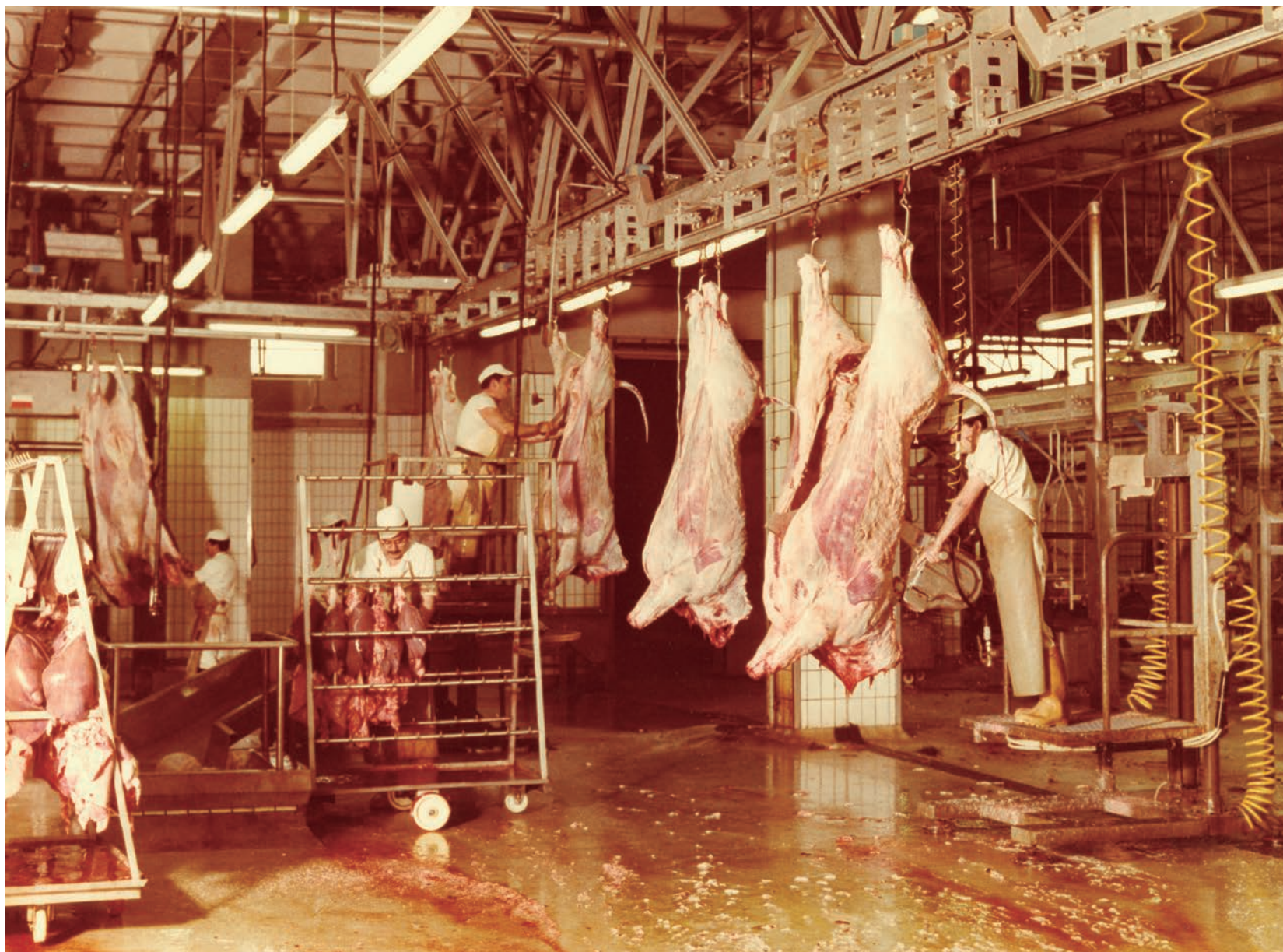
Operaris treballant a la línia de boví de l'Escorxador de Mercabarna a la dècada dels vuitanta.