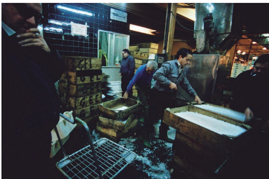
El Mercat Central del Peix de Mercabarna, ja en funcionament.