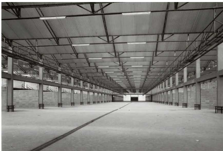
A dalt, la inauguració de Mercabarna, presidida pel general Franco i membres del seu govern. A baix, un dels pavellons del Mercat Central, dies abans de la seva obertura.