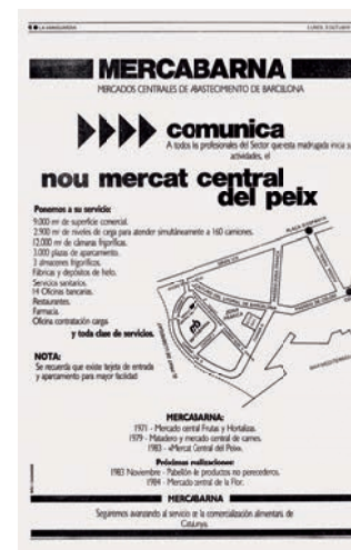
Inauguració del Mercat Central del Peix ( La Vanguardia , 3 d'octubre de 1983).