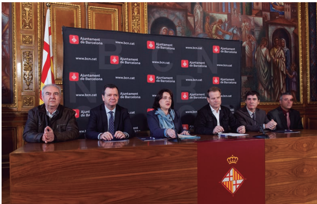
Els representants de Mercabarna, de l'Ajuntament de Barcelona i del gremi de majoristes i cooperatives durant la signatura del conveni.