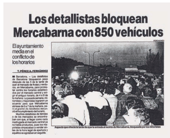
El Periódico, 19 de gener de 1988.

Amb el pas del temps, s'ha fet palès que el canvi d'horari ha estat fonamental per a l'impuls nacional i internacional d'aquest Mercat i de les empreses que s'hi ubiquen.