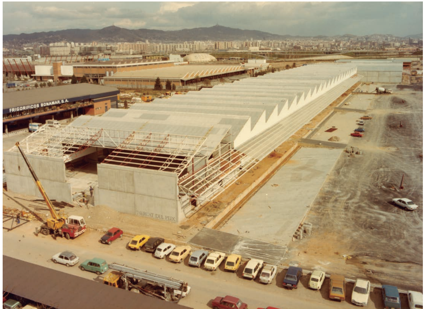
El Mercat Central del Peix de Mercabarna, en plena construcció.

Guarda en la memòria la gran caravana de cotxes particulars i carretons de la Cooperativa de Descàrrega —que traslladaven les mercaderies dels majoristes—, camí del primer dia de feina a Mercabarna.