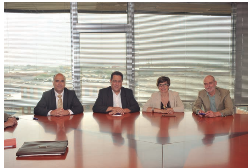
Els representants de les entitats que van constituir l'associació.