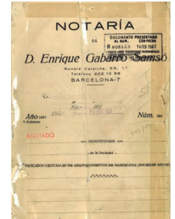
Estatuts fundacionals de Mercabarna.

L'any 1967 es posen els fonaments del que serà la primera Unitat Alimentària moderna d'Espanya, gràcies a la constitució de la societat anònima mercantil Mercados de Abastecimientos de Barcelona. Mercabarna neix amb l'objectiu d'acollir els mercats majoristes d'aliments frescos, ubicats al bell mig de la capital catalana, i resoldre els problemes logístics que generava l'activitat comercial majorista al centre de la ciutat. I més en un període marcat per una intensa onada migratòria a Catalunya que, en el cas de la província de Barcelona, va provocar un increment de la població de més del 36% en tan sols deu anys. Per alleugerir la pressió demogràfica i fer front als problemes urbanístics, s'opta per situar Mercabarna a la Zona Franca, en uns terrenys de noranta hectàrees ubicats en un emplaçament estratègic, molt a prop del port, l'aeroport i la terminal TIR de mercaderies, i molt ben connectat amb la resta d'Espanya i Europa per carretera.