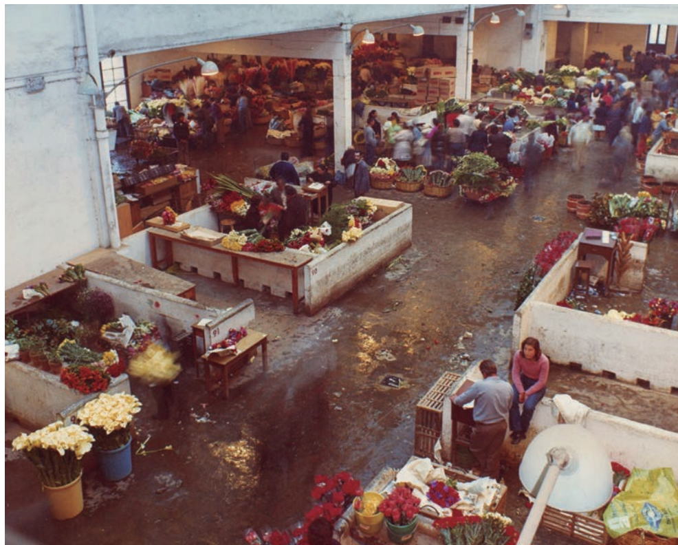
L'antic Mercat de la Flor del carrer Lleida acull actualment el Teatre Lliure.