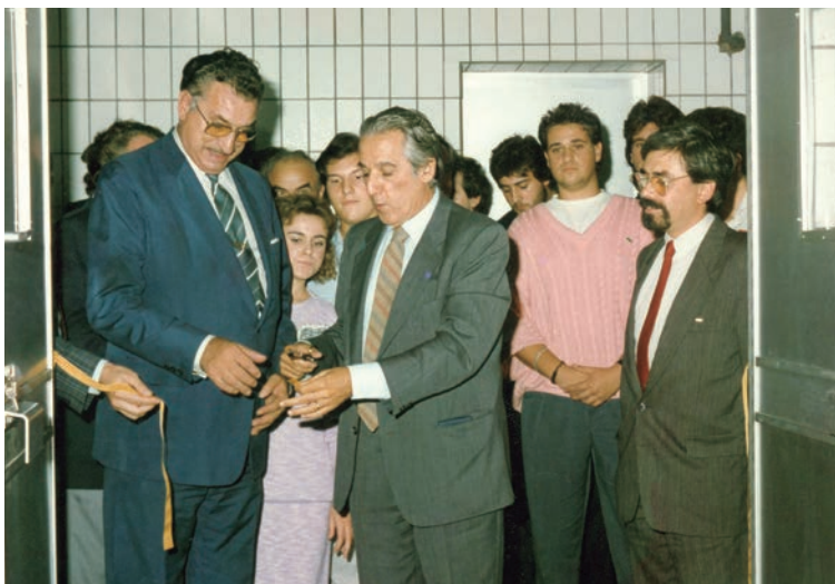
Inauguració de l'Escola de Carnisseria.