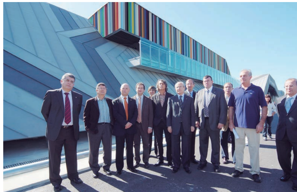
Autoritats i representants institucionals i empresarials inauguren Mercabarna-flor.