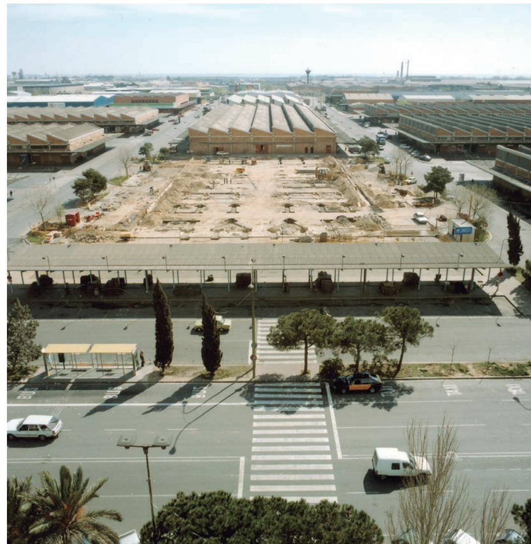
Obres d'ampliació del pavelló G del Mercat Central de Fruites i Hortalisses.