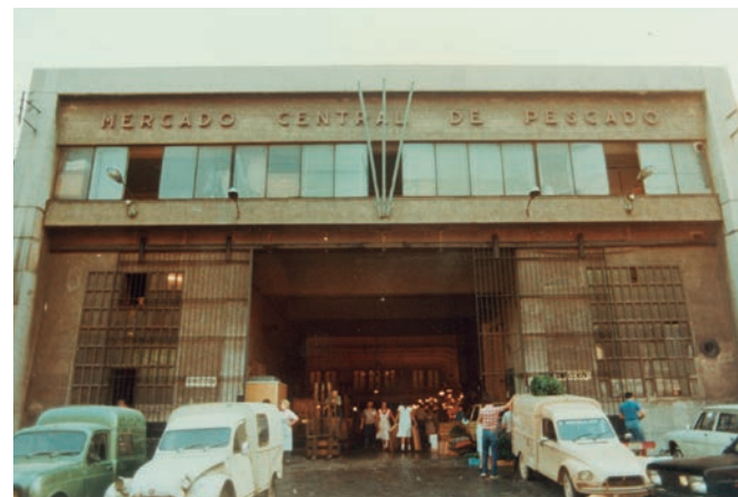
L'antic Mercat del Peix, ubicat fins al 1983 al carrer Wellington.

Amb il·lusió i ganes de treballar, va decidir canviar de rumb amb el nou mercat de Mercabarna, i va passar de detallista a majorista.