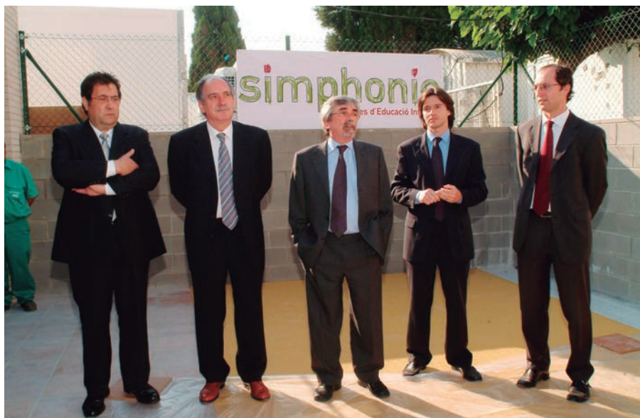
Acte d'inauguració de l'escola bressol del recinte.

Facilitar la conciliació laboral i familiar dels treballadors del recinte. Amb aquest objectiu, Mercabarna construeix una escola bressol perquè els usuaris del recinte hi puguin dur els seus fills i filles d'edats compreses entre els quatre mesos i els tres anys. Gestionada per l'empresa Simphonie i amb la col·laboració inicial de Mercabarna i Assocom, la filosofia del centre és la d'enfortir els lligams familiars acostant els més petits als centres de treball dels pares. Des de la seva obertura, aquesta escola bressol ha acollit aproximadament 700 infants.