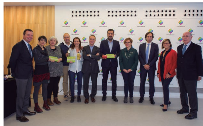
Els guanyadors de la segona edició dels premis 'Mercabarna Innova', amb el jurat i el director general de Mercabarna.

Procedent d'una família de llarga tradició pagesa, semblava gairebé predestinat a treballar entre fruites i hortalisses. Va voler, però, anar més enllà i en els darrers anys ha centrat els seus esforços a recuperar el gust del tomàquet clàssic de l'horta mediterrània.