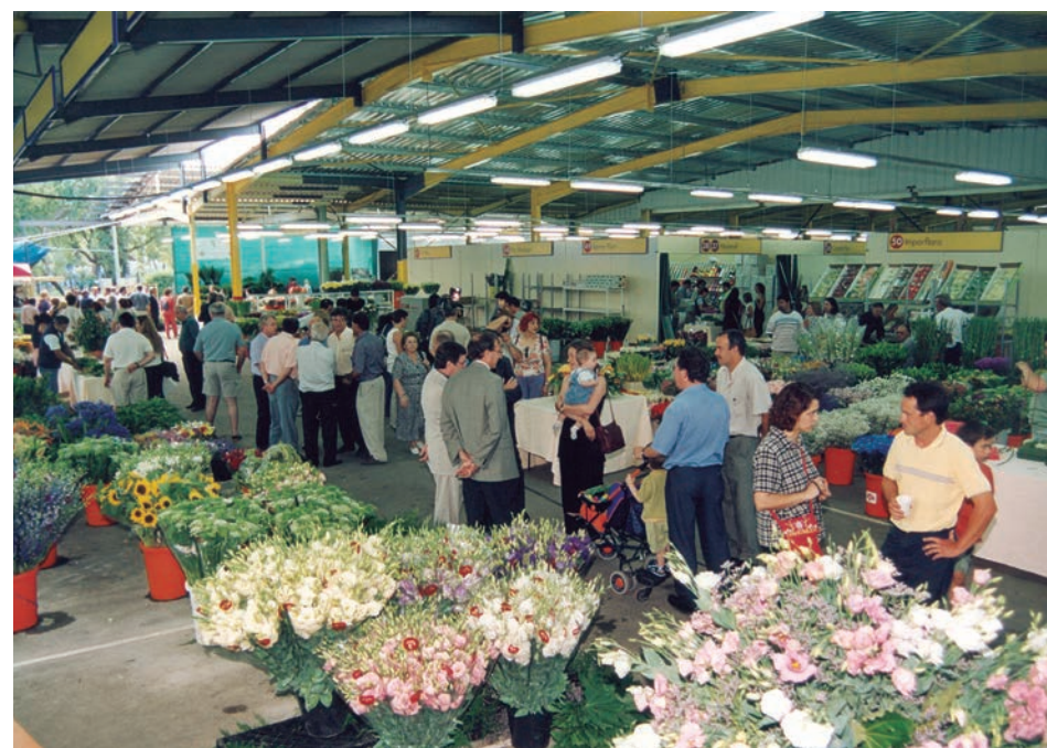
El Mercat de la Flor provisional va acollir els majoristes fins al 2008.