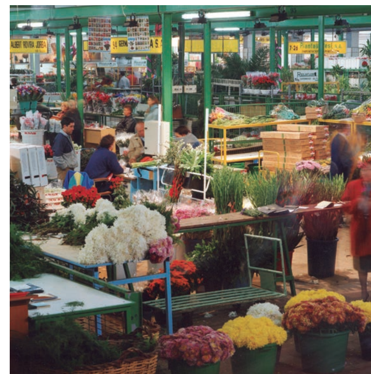
Activitat al Mercat Central de la Flor a Mercabarna.