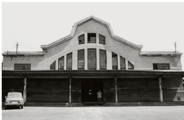
L'antic escorxador de Barcelona, situat a prop de la plaça Espanya.

El 14 d'agost del 1979 cessa l'activitat del que havia estat l'Escorxador de Barcelona, conegut com La Vinyeta i ubicat a la plaça Espanya des del 1891. El seu trasllat a Mercabarna suposa un pas endavant per a les empreses i els treballadors, que fins aleshores havien ocupat unes instal·lacions antigues, on les condicions de seguretat laboral havien quedat obsoletes. A més, dona resposta a les històriques reivindicacions dels veïns, que demanaven posar fi als problemes d'insalubritat associats amb l'activitat i recuperar l'espai per al barri. Al principi, el nou Escorxador de Mercabarna es concep com un equipament amb una capacitat elevada de matança, ja que disposa d'una línia de sacrifici de porc, dues de xai i cabrit, dues de vedella i una de cavall. Tanmateix, els canvis del sector carni a la Unitat Alimentària fan que es repensi la seva estructura i a l'inici dels anys noranta es deixa una línia per a oví i caprí i una altra per a boví i equí.