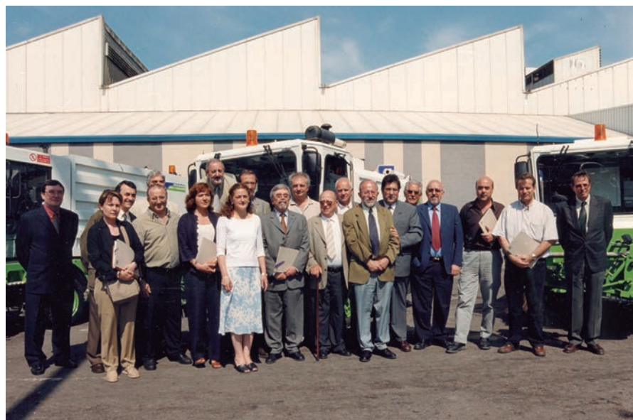
Els signants de l'Acord Cívic i el nou Punt Verd.

Pioner entre els mercats centrals d'Europa, el Punt Verd és un dels projectes més importants del Pla integral de gestió de residus de Mercabarna, que té per objectiu incrementar el volum de reciclatge. La posada en marxa d'aquest centre de recollida i selecció de deixalles coincideix amb la signatura d'un Acord Cívic entre la direcció del polígon alimentari i les associacions de majoristes i detallistes, pel qual tots els operadors i usuaris es comprometen a aplicar un nou model de recollida selectiva de residus i a col·laborar en la construcció d'una Mercabarna més neta i sostenible. Aquest nou sistema permet passar del 30 al 70% de volum de reciclatge.