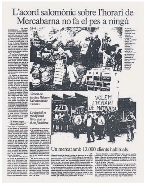
A dalt, El Periódico , 20 de gener de 1988. A baix, Avui , 7 de setembre de 1988.