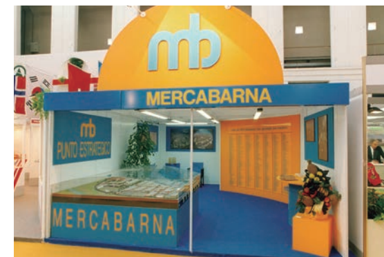
L'estand de Mercabarna a l'Alimentaria 1992.