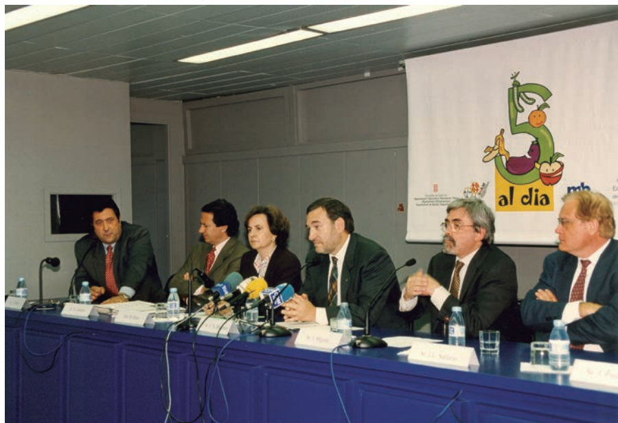
Roda de premsa de presentació de la prova pilot de "5 al dia".