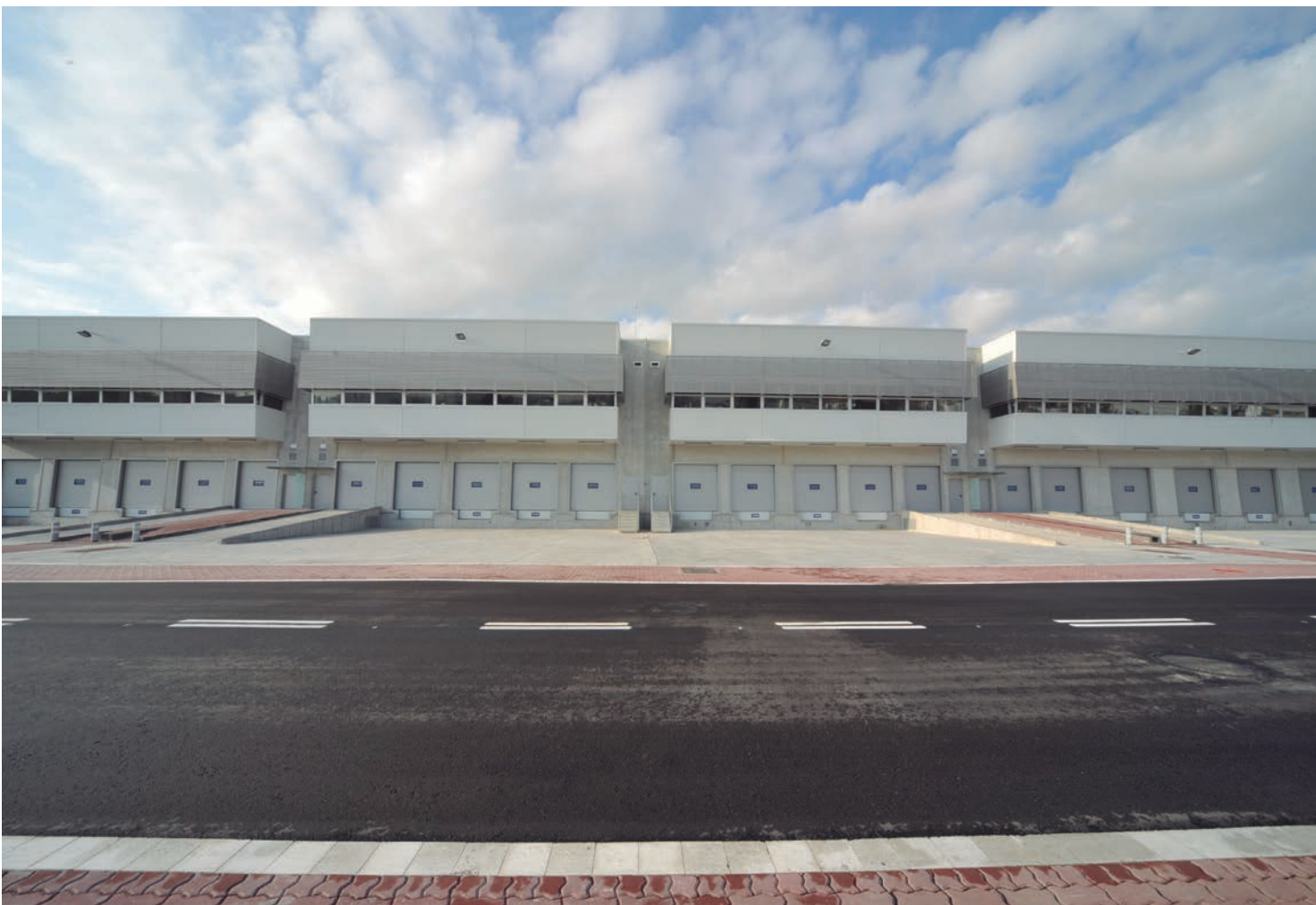
Presentació del Multiservei III.

Mercabarna adequa els terrenys que ocupava l'antic Mercat Central de la Flor amb la construcció del Multiservei III, una gran nau dividida en vuit magatzems, i la urbanització de quatre parcel·les edificables, per tal de guanyar espai dins de Mercabarna i potenciar la instal·lació d'empreses alimentàries dedicades a donar valor afegit i servei al client.