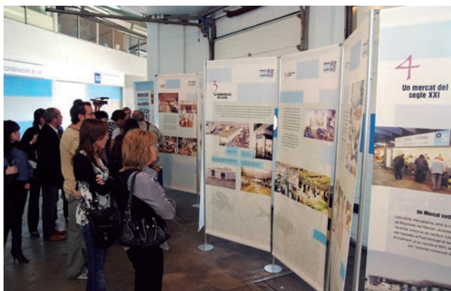
El concurs de manipulació de peix i l'exposició sobre la història del Mercat.