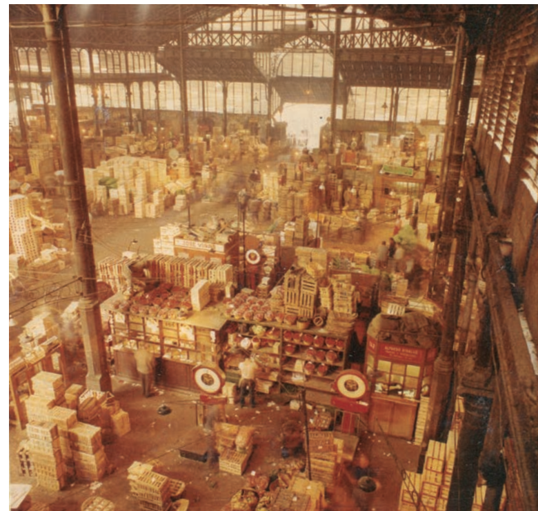
L'antic Mercat del Born de Barcelona, en plena activitat.